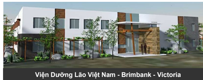
Viện Dưỡng Lão Việt Nam - Brimbank - Victoria

Viện Dưỡng Lão mới sẽ được đặt tên là Viện Dưỡng Lão Việt Nam ở Brimbank với 60 phòng khang trang, tiện nghi cùng với những trang bị tối tân, tọa lạc trên một khu đất rộng lớn cùng với một đội ngũ nhân viên giàu kinh nghiệm, cung cấp một dịch vụ chăm sóc hoàn hảo nhất cho giới cao niên Việt Nam tại tiểu bang Victoria.