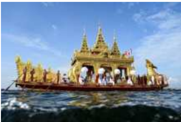
Tín đồ chèo xà lan vàng chở 4 tượng Phật linh thiêng trong lễ hội chùa Phaung Daw Oo ở Miến Điện

Vào sáng ngày 19 tháng 10 năm nay, chiếc xà lan vàng lướt qua làn nước mát lạnh, được kéo bởi những chiếc thuyền dài bằng gỗ bóng loáng. Theo sau là hàng chục chiếc thuyền chở đầy người cúng bái.