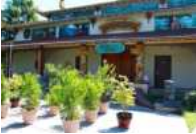
Chùa Pháp Hoa của người Việt (ảnh trên) và Trung tâm Thiền Kansas của Tích Lan tại Wichita

(Buddhistdoor Global - September 12, 2023)