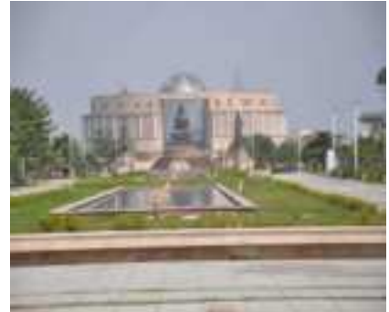
Đại học Phật giáo Cổ Đàm (GBU)

(Buddhistdoor Global - October 20, 2023)