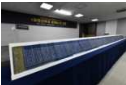
Tập 6 của "Kinh Saddharmapundarika", còn được gọi là "Kinh Pháp Hoa", được trưng bày tại Bảo tàng Cung điện Quốc gia Hàn Quốc