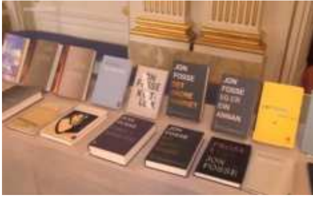
Một số tác phẩm của nhà văn, nhà thơ và kịch tác gia Jon Fosse, người đã thắng Giải Nobel Văn Chương năm 2023.