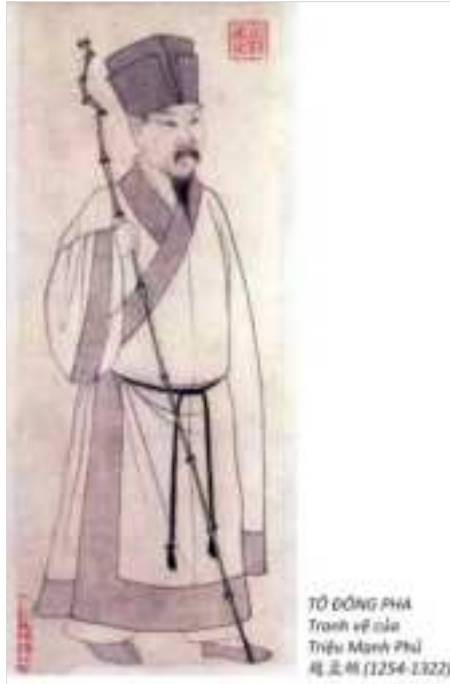
TÔ ĐÔNG PHA Tranh vẽ của Triệu Mạnh Phủ 1254-1322

Ngã dục thừa phong quy khứ 我欲乘風歸去 Hựu khủng ngọc lâu ngọc vũ 又恐瓊樓玉宇 Cao xứ bất thăng hàn 高處不勝寒 Khởi vũ lộng thanh ảnh 起舞弄影 Hà tự tại nhân gian! 何似在人間!