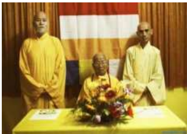
Từ trái: HT. Thích Quảng Độ, HT. Thích Huyền Quang, và HT. Thích Tuệ Sỹ trong Đại Hội Bất Thường tại TV Nguyễn Thiều, ngày 01.10.2023.

Dòng lịch sử thì cứ tuôn chảy; tuôn chảy một cách trầm lặng, nhưng miên man, rạt rào, bất tận... Dòng lịch sử ấy, bánh xe lịch sử ấy đã và đang nghiền nát tất cả mọi chướng vật cản trở phía trước, và cuốn trôi đi tất cả rong rêu rác rưởi vào biển cả để hòa tan theo tính mặn của biển và nước xanh của lòng đại dương.