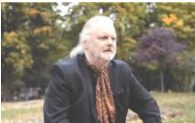
Quán Quân Giải Nobel Văn Chương 2023 Jon Fosse đang nói về các tác phẩm của ông.

Nhưng quán quân của Giải Nobel Văn Chương 2023 Jon Fosse là ai?