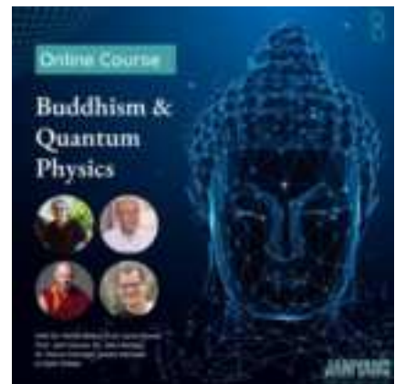
Poster của chương trình 'Phật giáo và Vật lý lượng tử' với ảnh của các diễn giả

(Buddhistdoor Global - September 8, 2023)