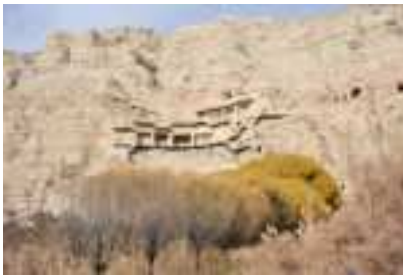
Hang động Kizil nằm ở bờ phía bắc của sông Muzal, thuộc huyện Baicheng, Khu tự trị Duy Ngô Nhĩ Tân Cương