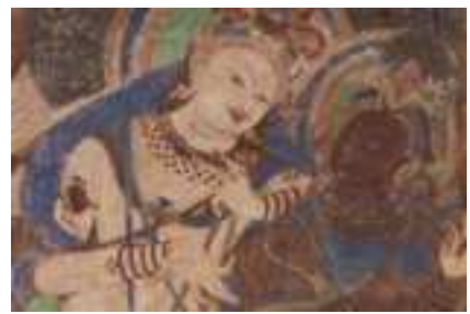
Một số bức tranh tường Phật giáo đầy màu sắc tại Hang động Kizil ở Tân Cương