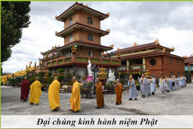
Đại chúng kinh hành niệm Phật