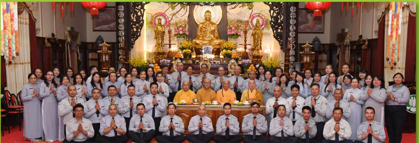
Chư Tôn Đức và quý Huynh Trưởng GDPT lưu niệm sau lễ Truyền Đăng tại TV Quảng Đức tối 30/12/24