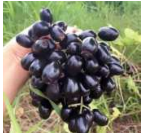
Trái trâm

Cả một chuỗi dài tháng năm hồn nhiên vô tư ấy, chuyên cần nghe theo lời Bà dạy, đến nỗi thuộc hết cả một quyển kinh Vu Lan - Báo Hiếu , biết lạy Phật hơn các bạn đồng lứa một cách tự hào lắm liệt! Không biết “công đức” non nớt ấy của mình có giúp cứu vớt được bao nhiêu vong nhân suốt chừng đó năm không, nhưng cái nhận biết ban đầu của mình thấy được là có thật rằng: “ Tháng Sáu buôn nhãn bán trâm/ Tháng Bảy Ngày rằm Xá Tội Vong