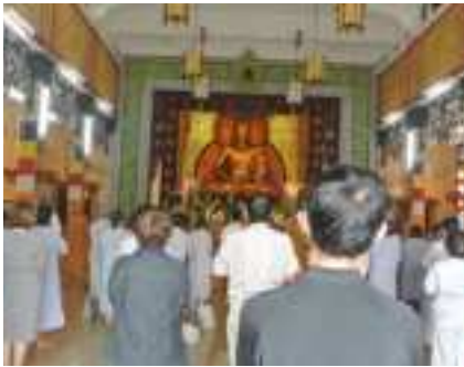
Đánh lễ Phật

Chiều cùng ngày, chùa Phật học Xá Lợi cũng đã tổ chức lễ quy y cho 70 Phật tử. 🌸