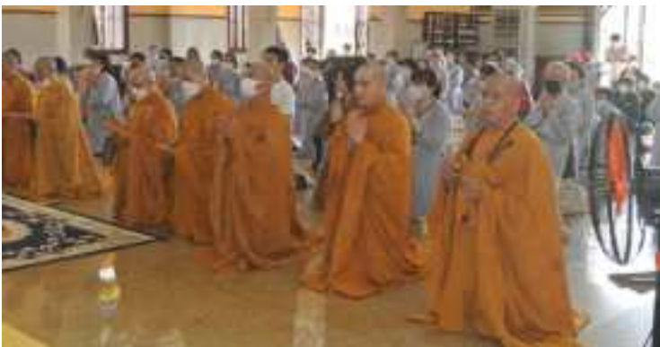
Chư Tăng cùng Phật tử tụng Sám khánh đản