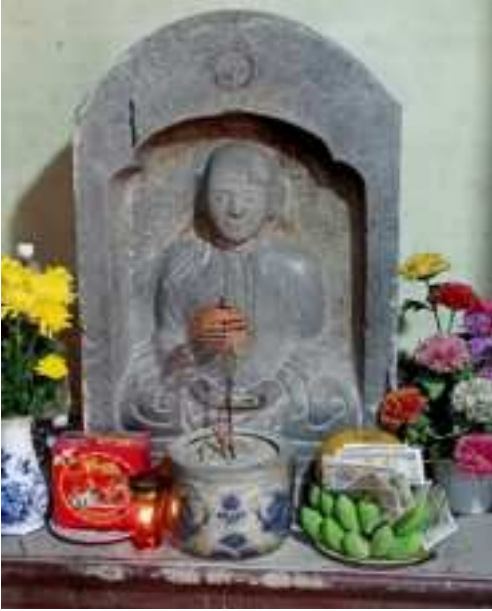
Tượng Hậu Phật tại chùa Bảo Quang