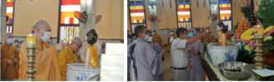
Chư Tăng và Phật tử thành kính tắm Phật