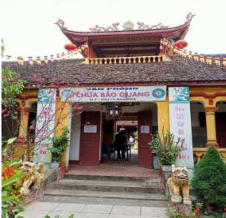
Lầu chuông và văn phòng chùa Bảo Quang (12/2/2022)

Hoạt động trùng tu, tôn tạo chùa diễn ra dựa theo nội dung các văn bia còn lại. Văn bia sớm nhất là bia Trùng Tu Bảo Quang Tự Bi Ký 2 được tạo khắc vào năm Đoan Thái thứ 2. Trong bia có đề cập tới việc Bảo Quang tự đã từng là một danh lam đứng đầu huyện Bạch Hạc nhưng do chiến tranh mà bị phá hủy nên được các thiện nam, tín nữ tất cả 80 vị góp tịnh tài để trùng tu, tôn tạo chùa. Tiếp đến là các văn bia như: bia Tân Tạo Ngọc Hoàng, Chư Phật Bảo Quang Tự Bi Ký được tạo khắc vào năm Hưng Trị thứ 4 (1591); bia Không Có Tên được tạo khắc vào năm Cảnh Trị thứ nhất (1663); Bia Lập Thiên Đài Thạch Trụ được tạo khắc vào năm Chính Hòa thứ 2 (1681); Bia Bảo Quang Tự được tạo khắc vào năm 1684; Bia Hậu Phật Bia Ký tạo khắc vào năm Vĩnh