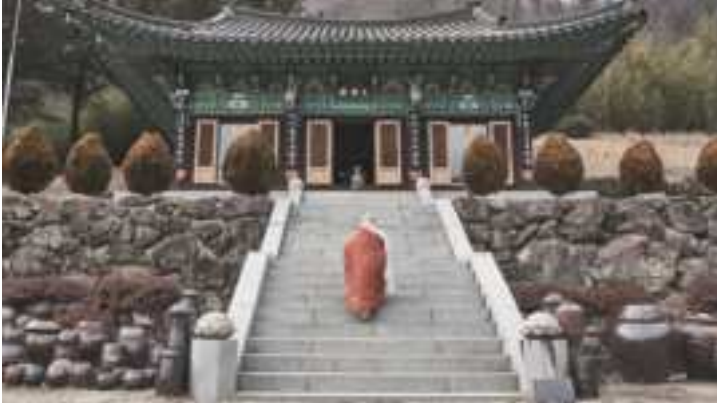
Ni sư Jeong Kwan sinh năm 1957, cống hiến đời mình cho Phật pháp năm 17 tuổi