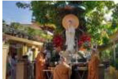
Nghi thức lễ vía tại tôn tượng Quan Thế Âm (cũ)