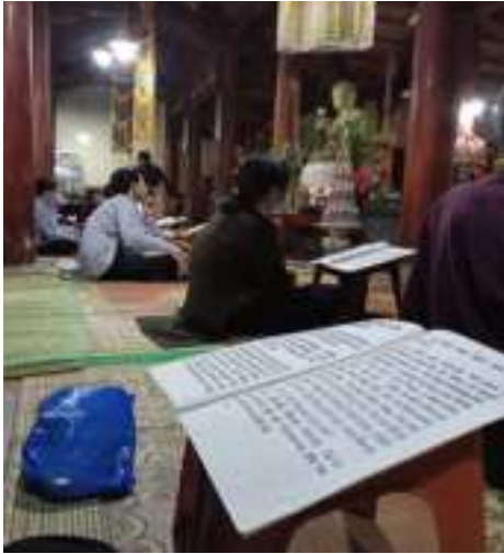
Khóa lễ ngày 14 âm lịch (25/5/2021)

đến nhiều đó là Ngọc Hoàng Thượng đế, Nam Tào, Bắc Đẩu - những vị thần của Đạo giáo; các tính chất của Phật giáo Bắc truyền và pháp tu Tịnh độ cũng được thể hiện qua lời khấn như “Phật giác tha”, “Phật Di Đà”... Hình thức dâng sớ này không chỉ tồn tại ở chùa Bảo Quang mà tại một số các ngôi chùa khác thuộc vùng đồng bằng Bắc Bộ. Tuy nhiên, việc duy trì