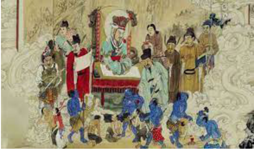
Lễ xá Tội Vong Nhân theo quan niệm dân gian