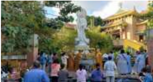
Nghi thức lễ vía tại tôn tượng Quan Thế Âm (mới)

Với 12 hạnh nguyện đại từ đại bi - ban vui và cứu khổ, Ngài là chỗ nương tựa của vô lượng chúng sinh gặp cơn khổ nạn. Đức hạnh của Ngài thật không thể dùng lời nào để tán thán. Chúng ta chỉ có thể một lòng thành kính phủ phục trước tâm lợi tha quảng đại của Ngài và nguyện học theo hạnh Ngài để mở rộng lòng thương của mình.