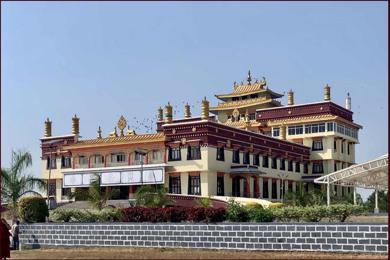
Ảnh minh họa – Tu Viện Tashi Lhunpo, Ấn Độ