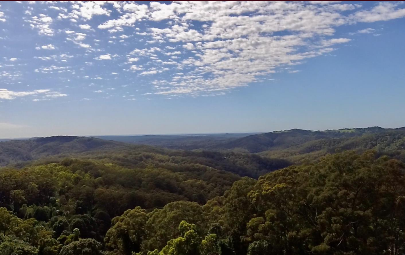
Toàn cảnh địa điểm chánh điện mới