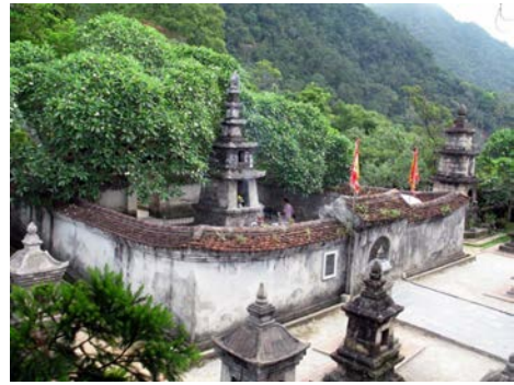
Vườn tháp Huệ Quang trong khu Yên Tử, nơi thờ Vua Trần Nhân Tông và những vị Thiền Sư cao đạo do tăng môn Thiền phái Trúc Lâm Yên Tử xây dựng vào năm 1309

“Càng nhắm càng cao, Càng dùi càng cứng, Bỗng nhiên vừa phía hậu, Nhìn lại đã mặt tiền, Ôi đó mới thật là, Thiền của Thượng sĩ!” (15)