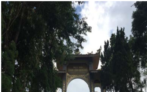
Cổng Thiên Viện

Trường Sơn được chia thành Trường Sơn Bắc và Trường Sơn Nam, ngăn cách bởi đèo Hải Vân và núi Bạch Mã. Núi Bạch Mã nằm ở độ cao 1,450 mét so với mực nước biển, khí hậu lý tưởng quanh năm với nhiệt độ từ 19-21°C (66-70°F), Bạch Mã được xem là trung tâm của dãy Trường Sơn, giao hòa giữa hai miền Nam - Bắc. Năm 1932, Một kỹ sư người Pháp tên Girard chọn để trở thành một đồi cho căn cứ của chính quyền Pháp. Trong những năm tiếp theo, họ thành lập một ngôi làng bao gồm 139 biệt thự và khách sạn. Để tránh đi lại trên con đường dốc dài 19 km (12 miles) đến thị trấn lớn để mua sắm, một con đường được thành lập song song với một bưu điện, chợ và bệnh viện. Đến 1945, Pháp mất quyền cai trị ở Đông Dương, Bạch Mã cũng bị lãng quên và các biệt thự bị bỏ hoang, và hoàn toàn bị hủy hoại chỉ còn lại một vài bức tường đá. 1962 được chính phủ miền Nam Việt Nam tuyên bố là khu vực được bảo vệ. Năm 1986, khu vực này được thành lập như một công viên quốc gia.