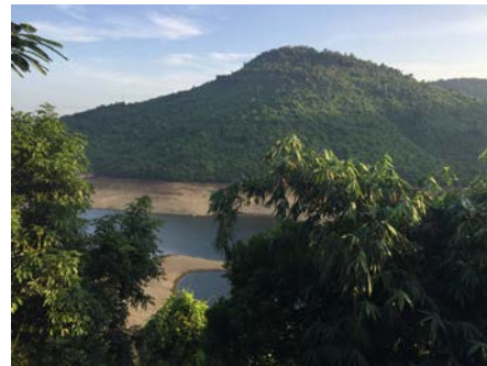
Hồ Truồi nhìn từ Ni viện