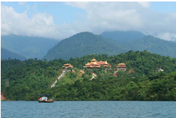
Thiên Viện Trúc Lâm Bạch Mã

Muốn đến Trúc Lâm Bạch Mã phải đi thuyền qua hồ Truồi. Trên núi cao Bạch Mã có tượng Phật sùng sừng như chờ đợi khách lãng du quay về. Sự may mắn được viếng cảnh thiên viện và tịnh tâm trong vài giờ, vài ngày cũng là một duyên lớn đối với người Phật Tử. Chữ Duyên trong đạo Phật sẽ giải thích sự hiện hữu của Đất Trời, của cảnh vật và của chúng ta nơi đó. Duyên là điều khó hiểu và khó giải thích trong đạo Phật, nhưng có những điều chúng ta cũng không thể nghĩ bàn. Nên duyên cho ai về đây để tận hưởng những giờ phút yên lành trong hiện tại.