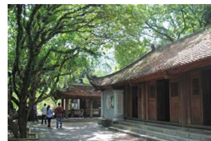
Chùa Suối Tắm – Trong Khu Yên Tử - Thời Trần Nhân Tông