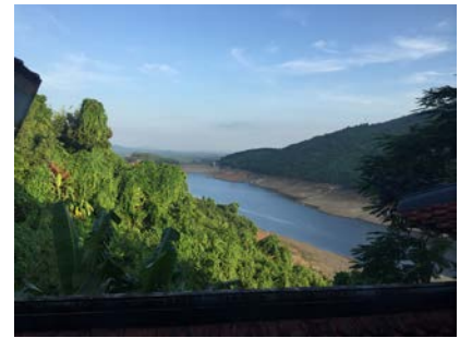
Hồ Truồi dưới chân Thiên Viện