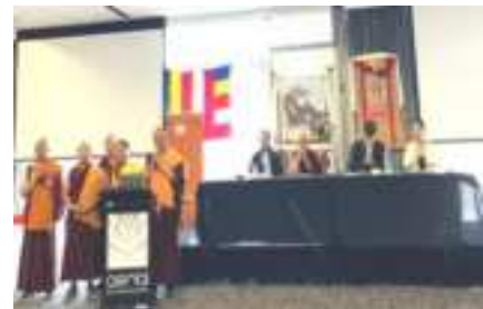
Cuộc họp Hội đồng thành phố San Jose về việc xây dựng ngôi chùa Phật giáo theo kế hoạch của cộng đồng Cam Bốt