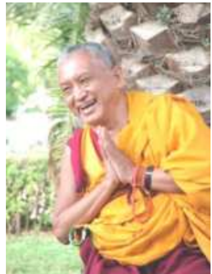
Lạt ma Zopa Rinpoche