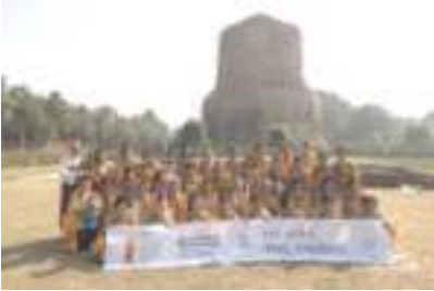
Đoàn người hành hương Jungto tại Sarnath (Lộc Uyển)