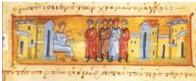
Một miêu tả về Josaphat của Thiên Chúa Giáo, bản thảo thế kỷ thứ 12.

Người Châu Âu ngày càng trở nên có hứng thú với các nền văn hóa và tôn giáo của Trung