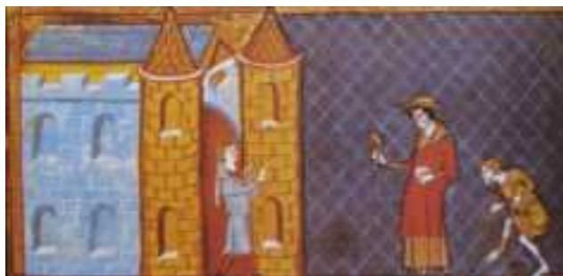
Thái Tử Josaphat gặp người bị bệnh cùi và bị tàn tật. Bản sao từ thế kỷ thứ 14 của tác phẩm 'Speculum Historiale' của Vincent de Beauvais.

Đông và Châu Á, hay điều mà sau này họ gọi là 'Đông Phương', như là một kết quả của các mối quan hệ trao đổi trong suốt kỷ nguyên thứ nhất của Tây Lịch. Các hình ảnh của đức Phật với chữ Hy Lạp ΒΟΔΔΟ ('Boddo' để chỉ Đức Phật - Buddha) được tìm thấy trên các đồng tiền vàng từ đế quốc Kushan (3) vào thế kỷ thứ hai Tây Lịch. Đức Phật đã được đề cập đến trong một nguồn tài liệu bằng tiếng Hy Lạp, 'Stromateis'(4), được viết bởi Clement of Alexandria vào khoảng đầu năm 200 Tây Lịch, và một nguồn tài liệu khác nói đến đức Phật được phát hiện trong tác phẩm 'Adversus Jovinianum'(5) được viết bởi St Jerome vào năm 393 Tây Lịch. Một truyền thuyết tôn giáo được lấy cảm hứng từ 'Cuộc Đời Của Đức Phật' được biết đến rộng rãi trong truyền thống Ba Tư-Do Thái và các phiên bản rất sớm bằng tiếng Ba Tư, Ả Rập, Do Thái, Armenian và Georgian đã được phát hiện. Câu chuyện đã trở thành phổ biến được biết như là 'Barlaam và Josaphat' vào thời trung cổ của Châu Âu. Danh xưng Josaphat, trong tiếng Ba Tư và Ả Rập được đánh vần một cách khác là Budasf, Budasaf, Yudasaf hay Iosaph, là sự sửa đổi sai lầm của danh hiệu Bồ-tát đại biểu cho 'đức Phật sẽ thành', là nói đến Thái Tử Tất-đạt-đa là người giáng ngộ thành đức Phật Cồ-đàm.