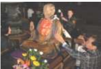
Tượng Hòa thượng Pindola của Chùa Zenkoji được nhìn thấy tại ngôi chùa này ở thành phố Nagano vào ngày 1-4-2009