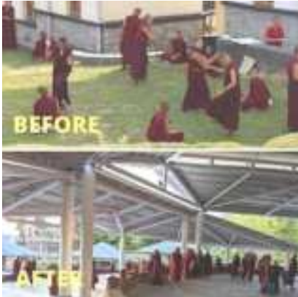
Sân tranh luận tại Ni viện Dolma Ling được mở rộng và cải thiện