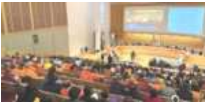
Hội nghị các Trung tâm Phật giáo Tây Tạng lần thứ nhất được tổ chức tại Sydney