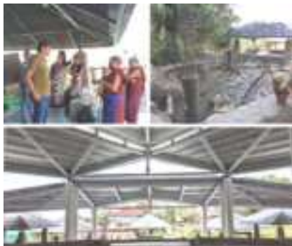
Công việc cải tạo sân trong của Ni viện Dolma Ling bắt đầu vào tháng 1 năm ngoái