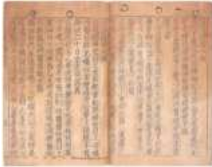
Một đoạn trích từ "Jikji" lưu trữ tại Thư viện Quốc gia Pháp