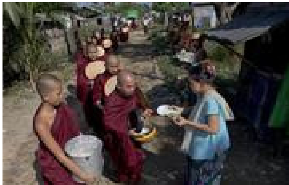
Tăng sĩ Miến Điện đi khát thực